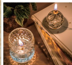
左下:さざれせはれードランプ丸型(小) 右上:あやせ小一輪 ※専用オイル芯とオイルは別売りです。

炎がゆらめくと、さざ波をイメージした模様がテーブルに映り込むのを楽しめます。また、一輪挿しにも、ランプとして使えるタイプがあります。冬の長い夜をロマンチックに過ごすインテリアとしておすすめです。