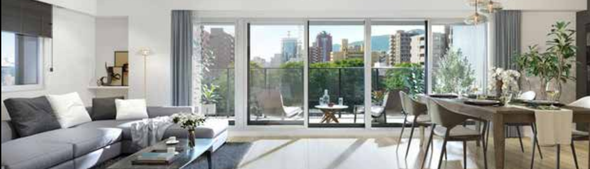
□リビング・ダイニング完成予想図(Cタイプ/設計変更プラン) ※掲載のリビング・ダイニング完成予想図(Cタイプ/設計変更プラン)は設計段階の図面に基に描き起こしたものに現地7階相当の眺望写真(2023年6月撮影)を合成したもので、形状・色等は実際とは異なる場合があります。形状の細部、設備機器等は表現していません。また家具・調度品・有価オプション等は販売価格に含まれません。眺望については将来に渡って保証するものではありません。予めご了承ください。